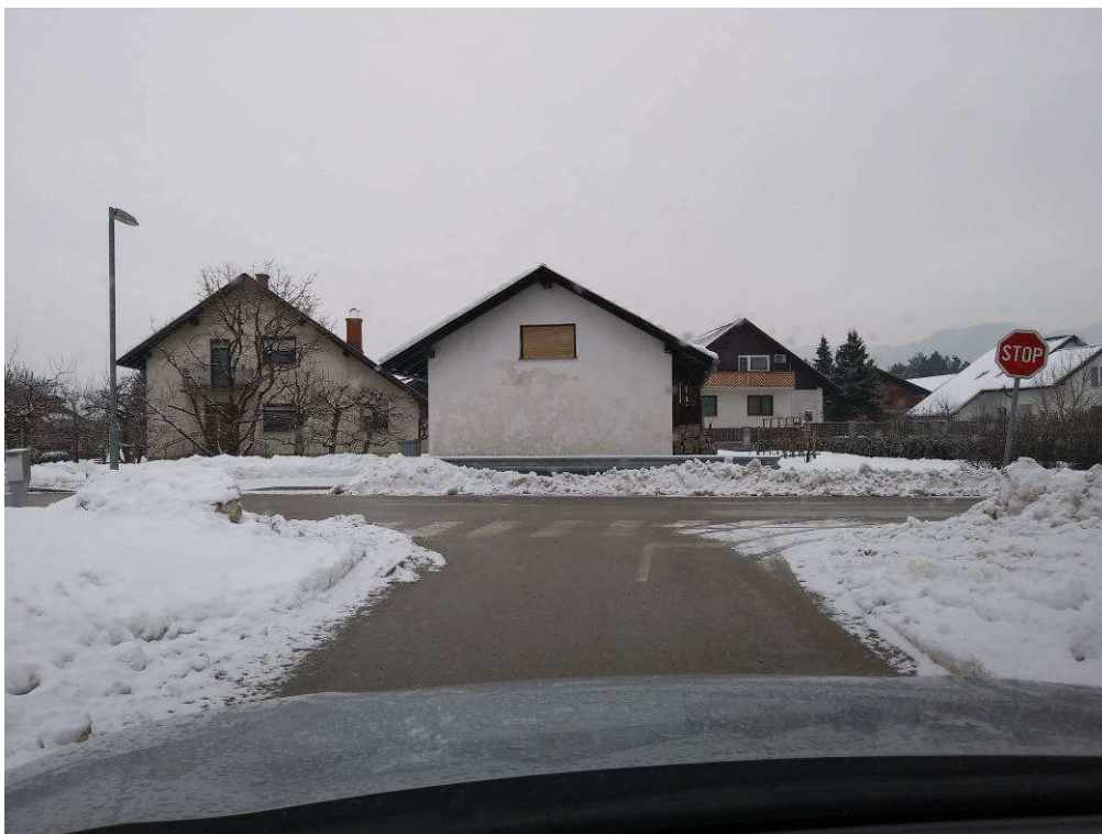
Slika 7: Konec trase