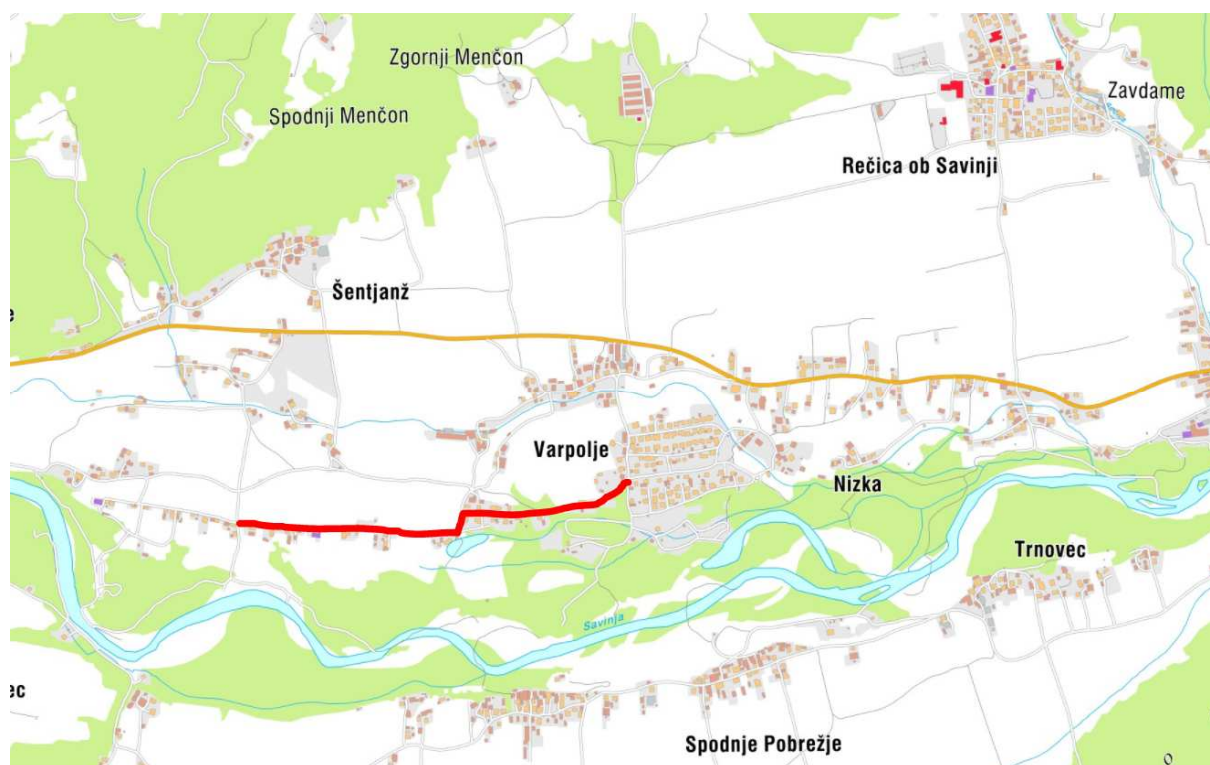
Slika 1: Lokacija odseka

Na osnovi naročila občine Rečica ob Savinji smo izdelali tehnično dokumentacijo za javni razpis rekonstrukcije lokalne ceste LC 267-132 v skupni dolžini 1200,00 m.