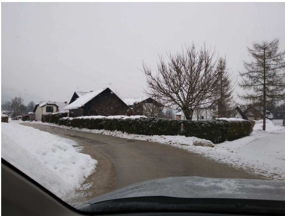
Slika 5: Pogled na traso