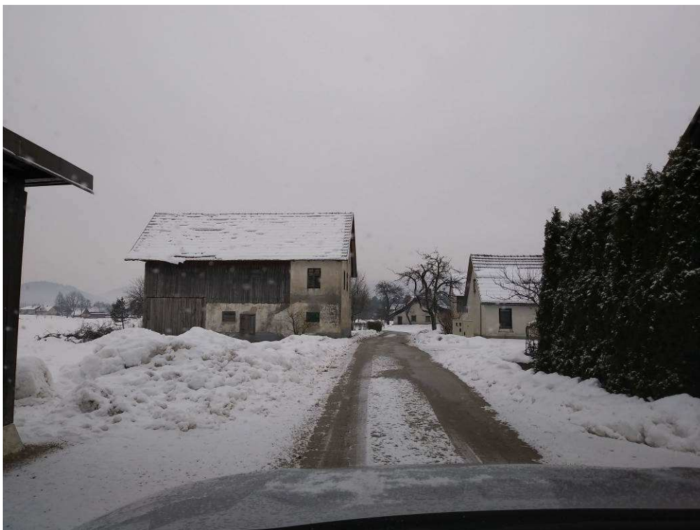
Slika 3: Pogled na traso