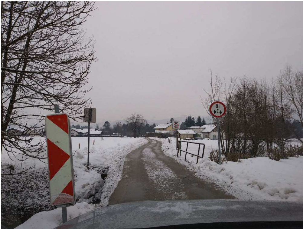
Slika 4: Pogled na traso