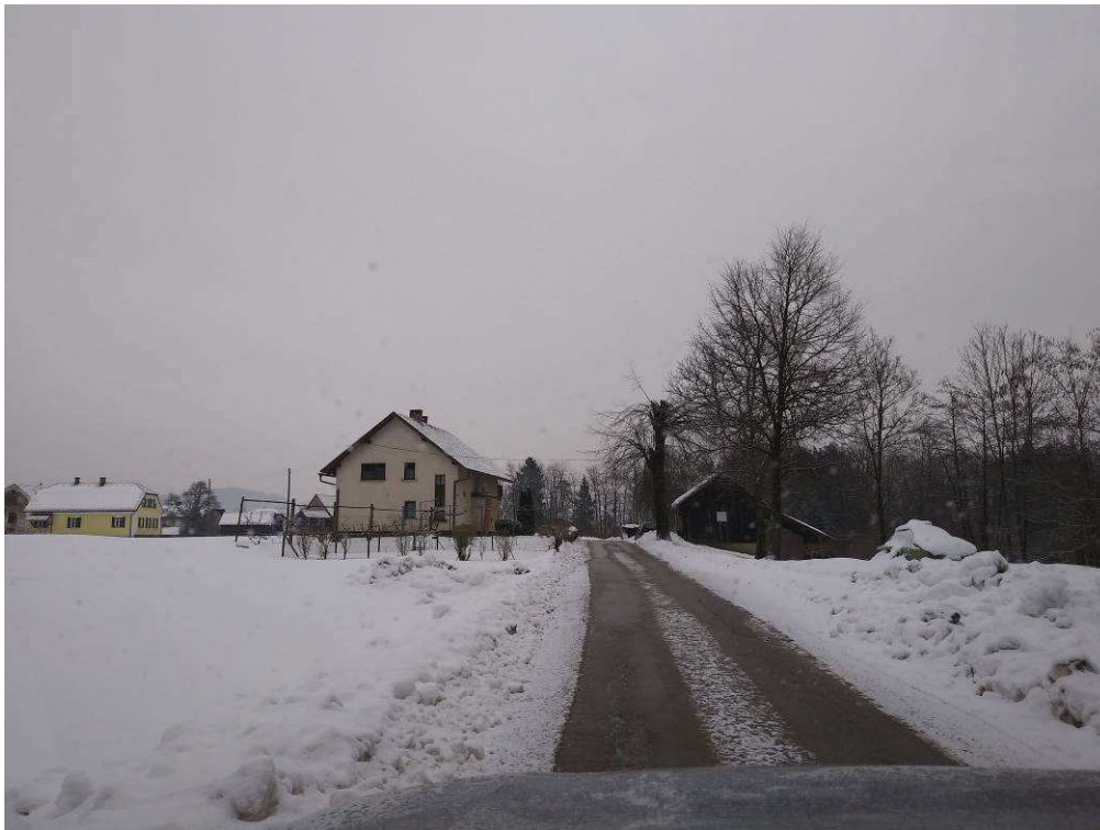
Slika 6: Pogled na traso