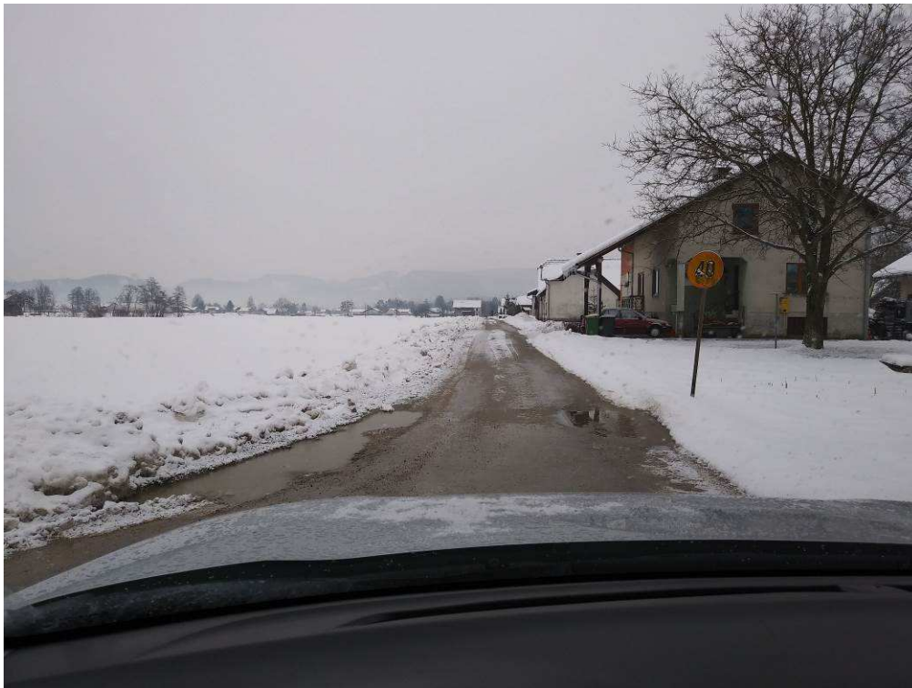
Slika 2: Začetek trase